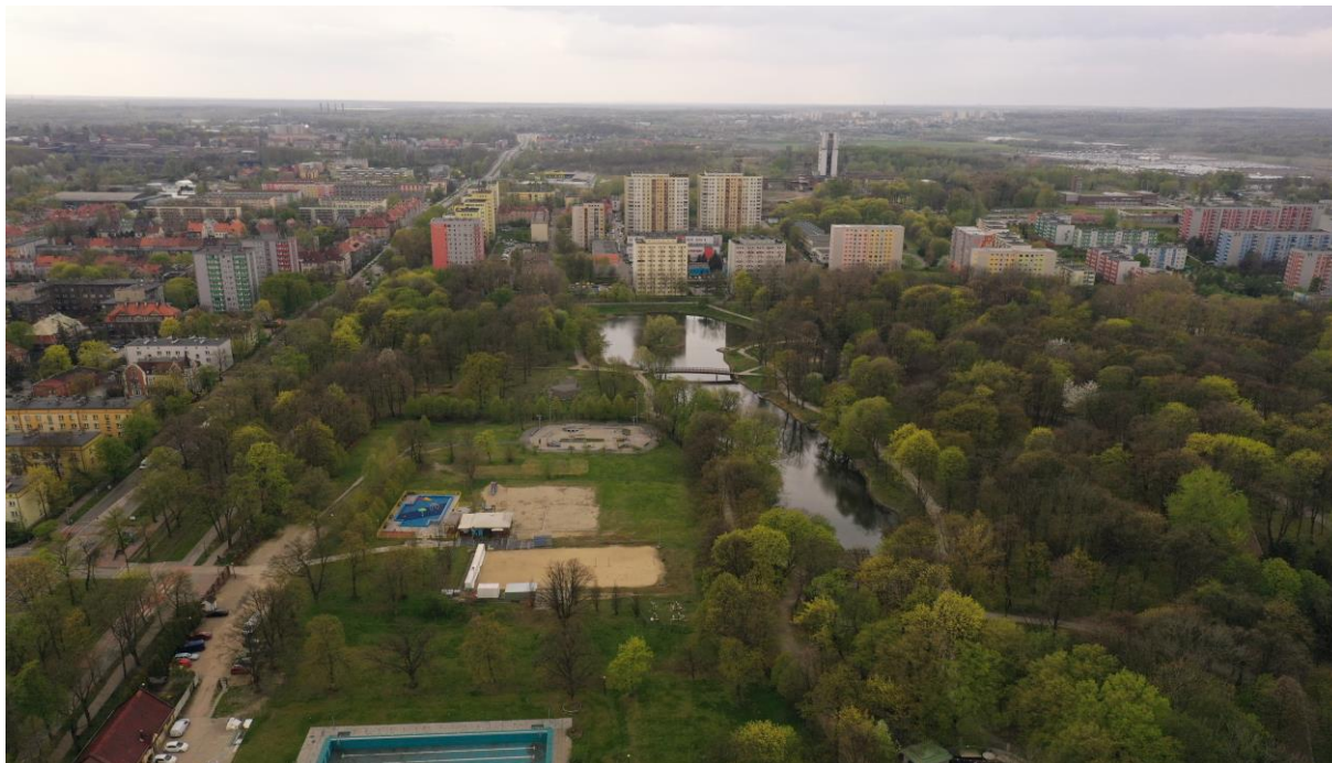
Park miejski Kachla – wodny plac zabaw i Staw południowy. Duży obiekt o funkcjach wypoczynkowych