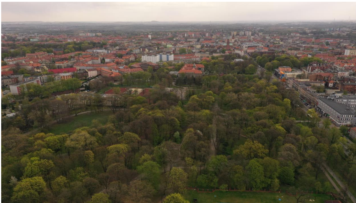
Park miejski Kachla – wybieg dla psów. Teren zieleni otoczony zabudową miejską