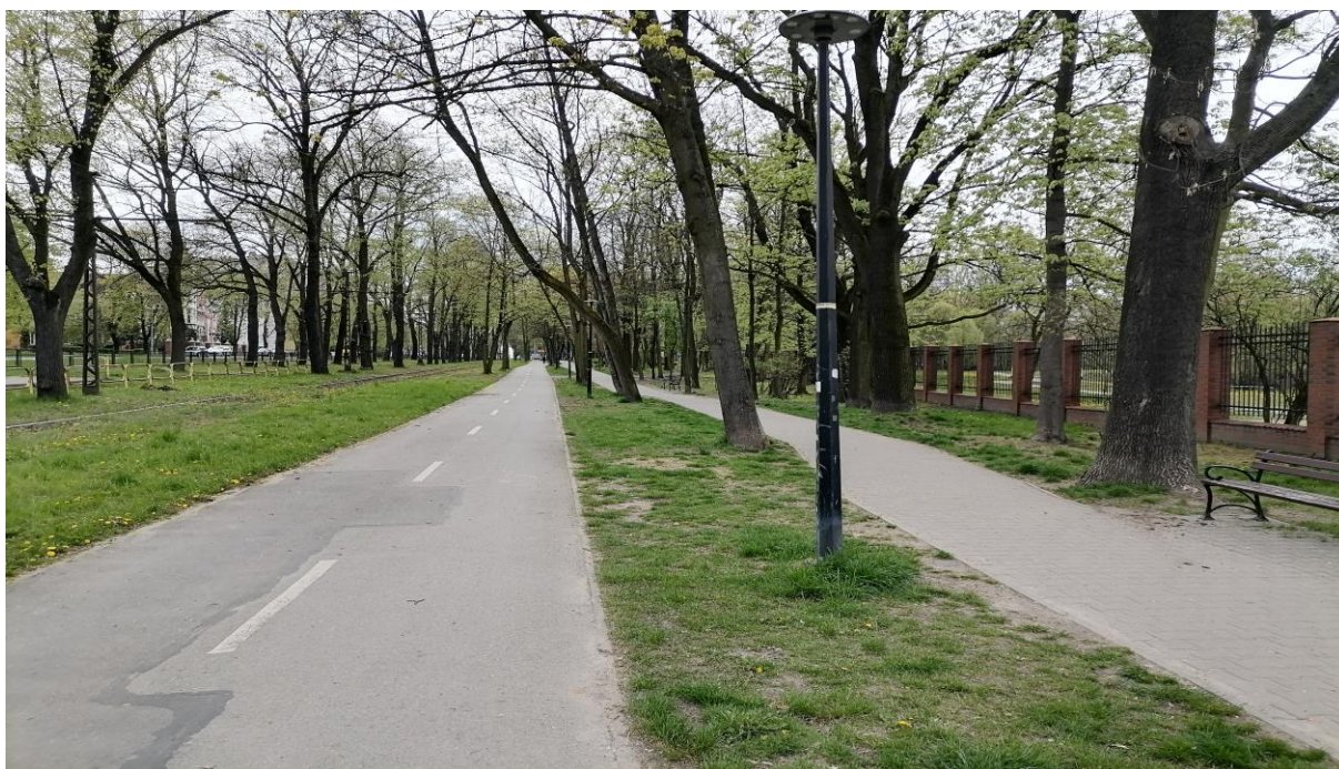
Park miejski Kachla - ścieżka otoczona zadrzewieniami parku